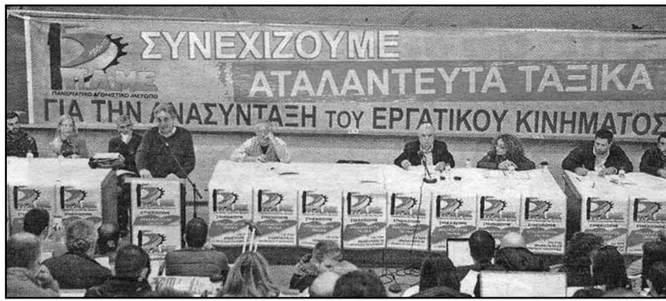
Από την Πανελλαδική Συντονιστική Επιτροπή του ΠΑΜΕ. Συνέπεσε με τα 15 χρόνια από την ίδρυσή του

Παλεύουμε για την ανασύνταξη του κινήματος Σε ταξική κατεύθυνση ενάντια στις αντιλαϊκές πολιτικές