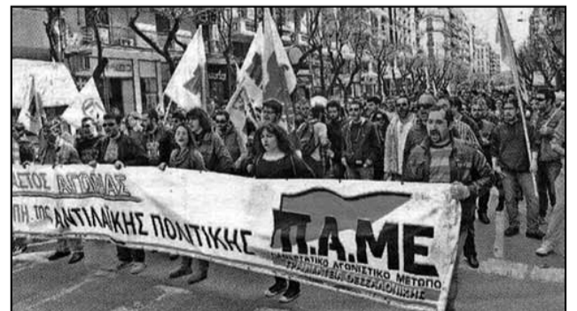
Από τη συγκέντρωση και πορεία του ΠΑΜΕ στη Θεσσαλονίκη ενάντια στο πολυνομοσχέδιο που κάνει τη ζωή των εργατών και του λαού ακόμα χειρότερη

«Τέρμα πια στις αυταπάτες, ή με το κεφάλαιο ή με τους εργάτες» Γι' αυτό στις εκλογές του Μάη ψηφίζουμε το κόμμα που μια ζωή είναι με τους εργάτες και ενάντια στο κεφάλαιο