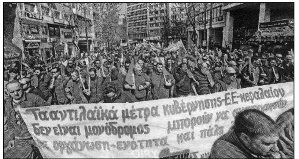
Από την 24ωρη Πανελλαδική απεργία στις 9 Απρίλη του ΠΑΜΕ στην Αθήνα Η συγκέντρωση ήταν από τις μεγαλύτερες των τελευταίων χρόνων

Στην Αθήνα η πιο μεγάλη συγκέντρωση των τελευταίων χρόνων Ανάλογες συγκεντρώσεις του ΠΑΜΕ έγιναν σε 62 πόλεις