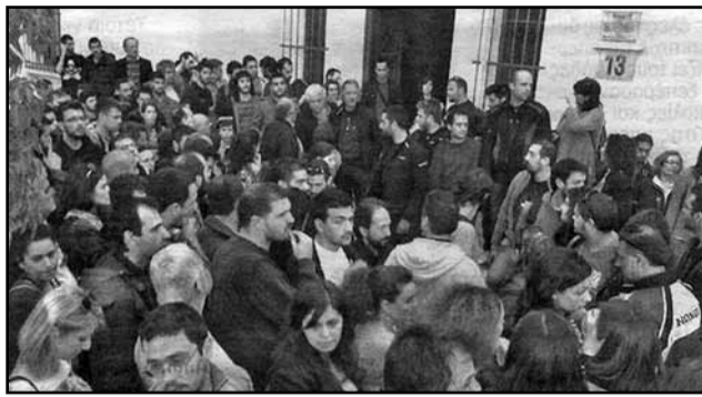
Από τη συγκέντρωση αλληλεγγύης έξω από τα δικαστήρια

Έτσι, με χαλκευμένες κατηγορίες, με μάρτυρες τα τσιράκια του Μάνεση και με την «αδέκαστη» δικαιοσύνη επέβαλαν βαριές ποινές, 23 μήνες φυλάκιση, σε 24 πρωτοπόρους αυτού του ηρωικού αγώνα, με πρώτο τον πρόεδρο του Σωματείου, Γ. Σιφωνιό, με τριετή αναστολή, που σημαίνει ότι