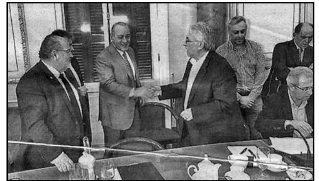
Ο πρόεδρος των βιομηχάνων όλο χαμόγελο δίνει το χέρι στον πρόεδρο της ΓΣΕΕ ύστερα από την απaráδεκτη συμφωνία για την Ε.Γ.Σ.Σ. Εργασίας

Οι μεγάλοι έπαινοι από τους βιομήχανους, έμπορους στην πλειοψηφία της ΓΣΕΕ αποδείχτηκε για