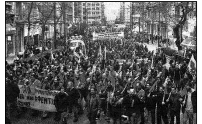
Από τη μεγάλη συγκέντρωση του ΠΑΜΕ στην Αθήνα όταν συνεδρίαζε το ΕΚΟΦΙΝ της λυκοσυμμαχίας για την κλιμάκωση της επίθεσης του κεφαλαίου

Θα τους το επιτρέψουμε; Στο χέρι μας είναι να το αποτρέψουμε, όπως και το ν 330, που αντικαταστάθηκε με το ν 1264/1982.