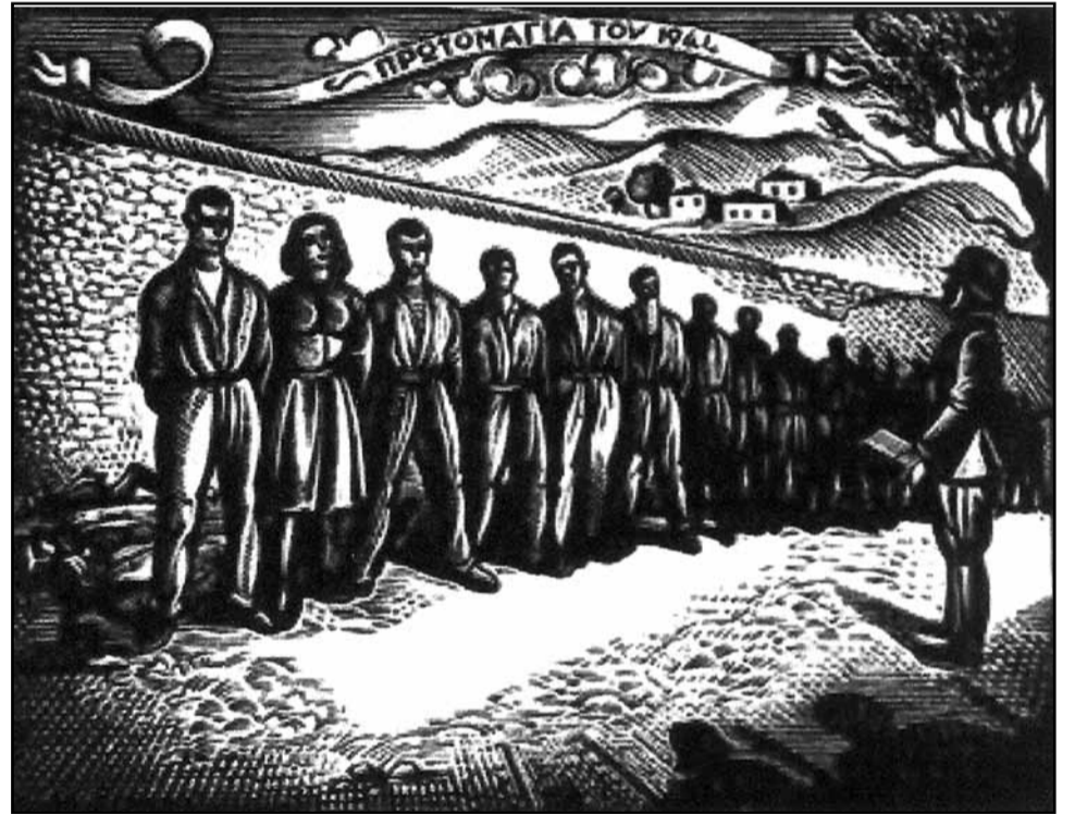
Από την εκτέλεση των 200 αγωνιστών - κομμουνιστών την Πρωτομαγιά του 1944 στην Καισαριανή από τους Γερμανούς φασίστες κατακτητές

Τη μέρα αυτή οι εργάτες στις συγκεντρώσεις τους κάνουν απολογισμό τι είχαν και τι έχασαν, και προβάλλουν τα αιτήματά τους για μια καλύτερη ζωή.