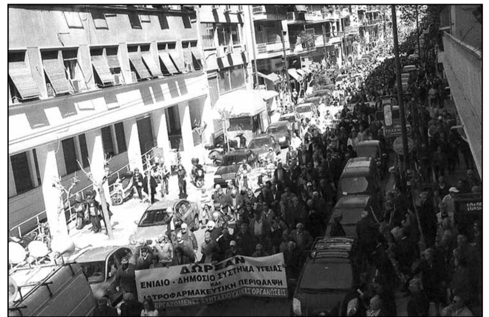
Από τη μεγάλη συγκέντρωση των συνταξιούχων της Αθήνας στις 20 Μάρτη για την υγεία μπροστά στο Υπουργείο Υγείας

υπόψη της η κυβέρνηση και οι Υπουργοί της. Θα μας βρίσκουν πάντα μπροστά τους σε κάθε μέτρο που θα πάρουν σε βάρος μας αφού δεν σκοπεύουμε να διπλώσουμε τις σημαίες του αγώνα.