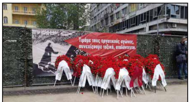
ΜΝΗΜΕΙΟ ΓΙΑ ΤΟ ΜΑΗ ΤΟΥ '36

γοί της COSCO έδιναν τη μάχη ενάντια στο κινεζικό μονοπώλιο και στην αρμάδα των αστυνομικών δυνάμεων, που η κυβέρνηση επιστράτευσε για την προστασία των συμφερόντων της πολυεθνικής του στρατηγικά εχθρικού, κατά τα άλλα, Κινεζικού καπιταλισμού. Μια μεγάλη συνάθροιση αλληλεγγύης, που το «γύρισε» στο εργατικό αγωνιστικό γλέντι και χορό. Πολεμάμε, γλεντάμε και χορεύουμε. Έτσι παλεύουν οι εργάτες.