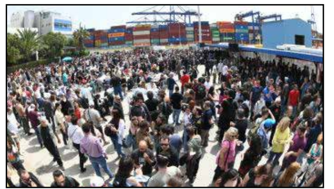
ΠΕΙΡΑΙΑΣ- ΠΡΟΒΛΗΤΕΣ COSCO

ΣΕΑ: Απόφαση για Πανελλαδικό Συλλαλητήριο στην Αθήνα στις 24 Ιούνη. Στη συνεδρίασή της στις 17 Μάη η ΣΕΑ αποφάσισε την διοργάνωση αυτής της κινητοποίησης, που κλείνει αυτό τον κύκλο των δράσεων μπροστά στο καλοκαίρι. Παραμένουμε σε επιφυλακή. Συνεχίζουμε.